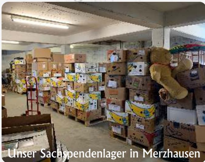
Unser Sachspendenlager in Merzhhausen

Medikamente, Konserven, Babybedarf, Babynahrung, Feuchttücher, Schnuller, Fläschchen, Windeln für Babys, Wasch- und Spülmittel