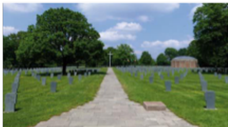
Cimetière Militaire Niederbronn-les-Bains

Zunächst bringt uns der Bus sicher nach Niederbronn-les-Bains in die Nordvogesen.