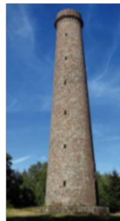
Tour au sommet du Grand Winterberg

Weiter geht es in Richtung des „Chalet“ des Vogesenclubs am Liese-Pass, wo die Mittagspause stattfindet (wahlweise auch Rucksackverpflegung). Frisch gestärkt, führt der Weg zum „Großen Winterberg“, wo der Turm des Vogesenclubs bestiegen werden kann. Auf dem „mythischen Pfad“ geht es zum „Keltischen Lager“ und von