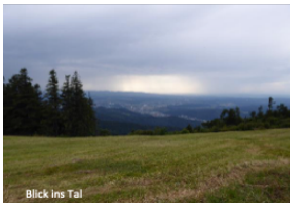
Blick ins Tal

Eine sportliche Tour für den geübten Wanderer. Die Wanderung bietet herrliche Ausblicke und eine abwechslungsreiche Streckenführung.